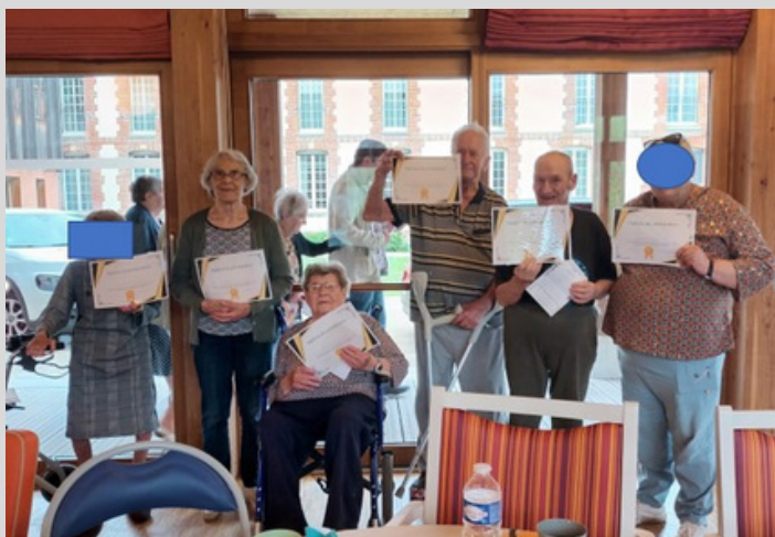
OLYMPIADES AVEC LES RPA