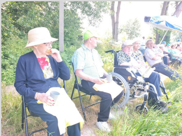
PIQUE NIQUE EN BORD DE SEINE